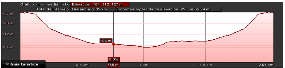
Carreira cadetes e infantís 2,05 km