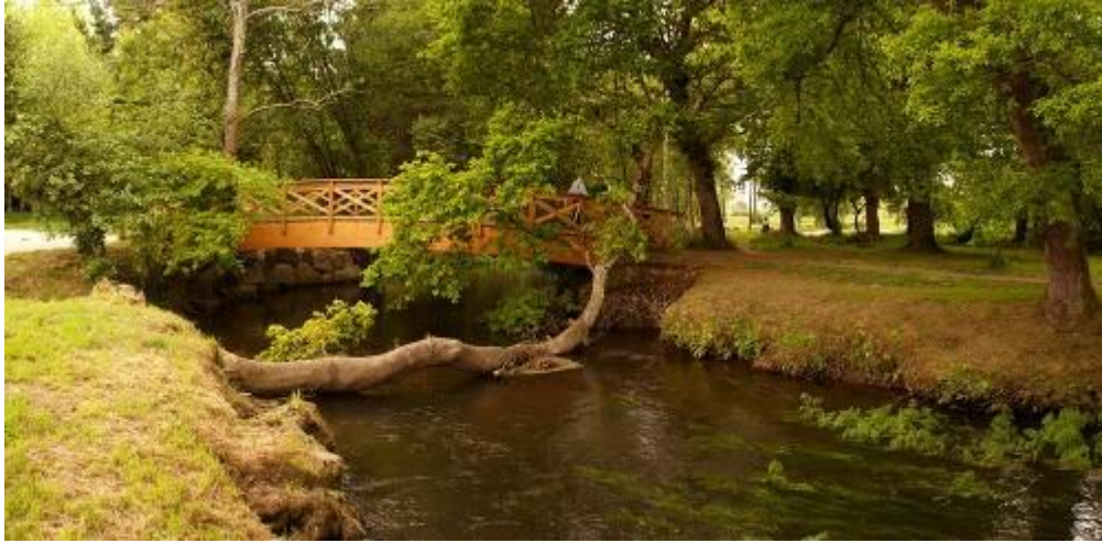
RÍO ANLLÓNS O SEU PASO POR CARBALLO